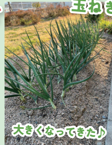
大きくなってきた♪