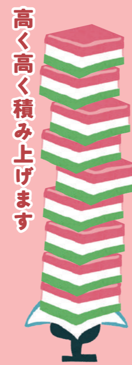
高く高く積み上げます