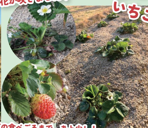
いちごの食べごろまで、あと少し！