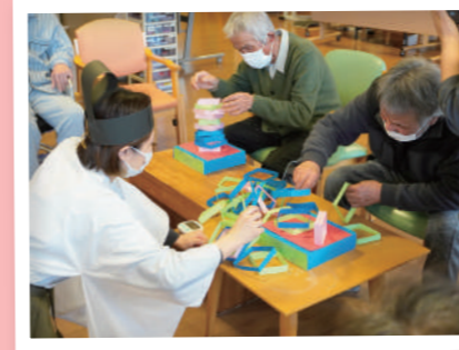
落とさないように...