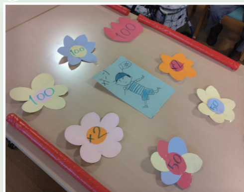
花飾りのちょうちよをうちわで仰いで移動させるゲーム！ 男の子に捕まえられると0点です。